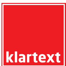
Abbildung nicht maßstabsgetreu

Klartext GmbH Am Güterverkehrszentrum 2 37073 Göttingen Tel. 0551 499 700